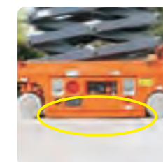
自动坑洞保护系统